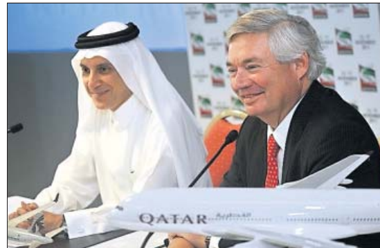
Freude nach der Vertragsunterzeichnung: Qatar-Chef Akbar Al Baker und Airbus-Verkaufsleiter John Leahy.

Dubai – Der europäische Flugzeugbauer Airbus hat bei der Luftfahrtmesse in Dubai weitere Milliardenaufträge erhalten. Die arabische Gesellschaft Qatar Airways gab am Dienstag eine Festbestellung über 50 Mittelstreckenmaschinen des Typs A320neo und fünf Exemplare des doppelstöckigen Großraumfliegers A380 ab. Der Flugzeugfinanzierer Aviation Capital Group (ACG) orderte zudem 30 Exemplare der auf Spritzen getrimmten A320neo, wie Airbus berichtete. Laut Preisliste ha-