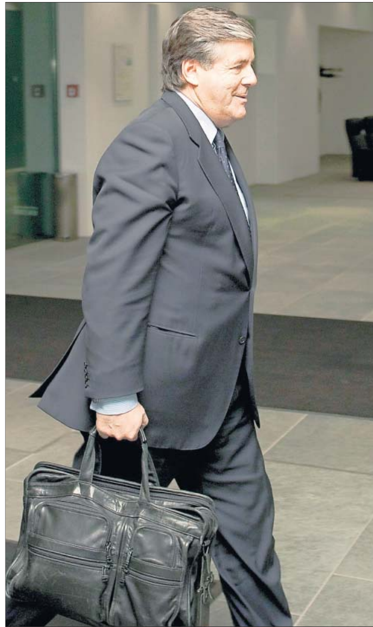
Verlässt den Chefposten bei der Deutschen Bank in stürmischer Zeit und verzichtet auch auf den Aufsichtsratsvorsitz: Josef Ackermann.

■ Stichwort Regulierung: Bislang kam die Deutsche Bank ohne Staatshilfe durch die jüngsten Krisen. Doch die Anforderungen der Regulatoren werden schärfer, vor allem, was die Kapitalpuffer großer Institute angeht. Die Deutsche Bank sei sehr gut auf die künftig strengeren Eigenkapitalvorschriften vorbereitet und könne diese vor Ablauf der festgelegten Fristen erfüllen, betonte Ackermann zuletzt. Er selbst warnt aber immer wieder davor, Europas Finanzinstituten zu viele Fesseln anzulegen, um